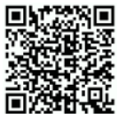
K120 3D demo