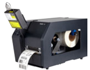
Online Barcode Validierung (ODV)