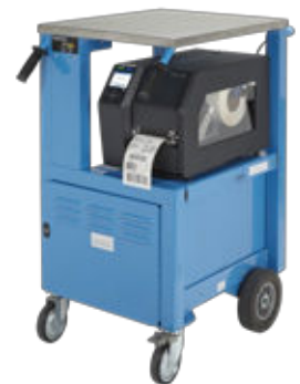
Motorbetriebener mobiler PrintCart