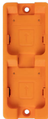
CHARGING STATION ODER 10-SLOT CHARGING STATION