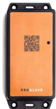
ACCESS POINT ODER GATEWAY